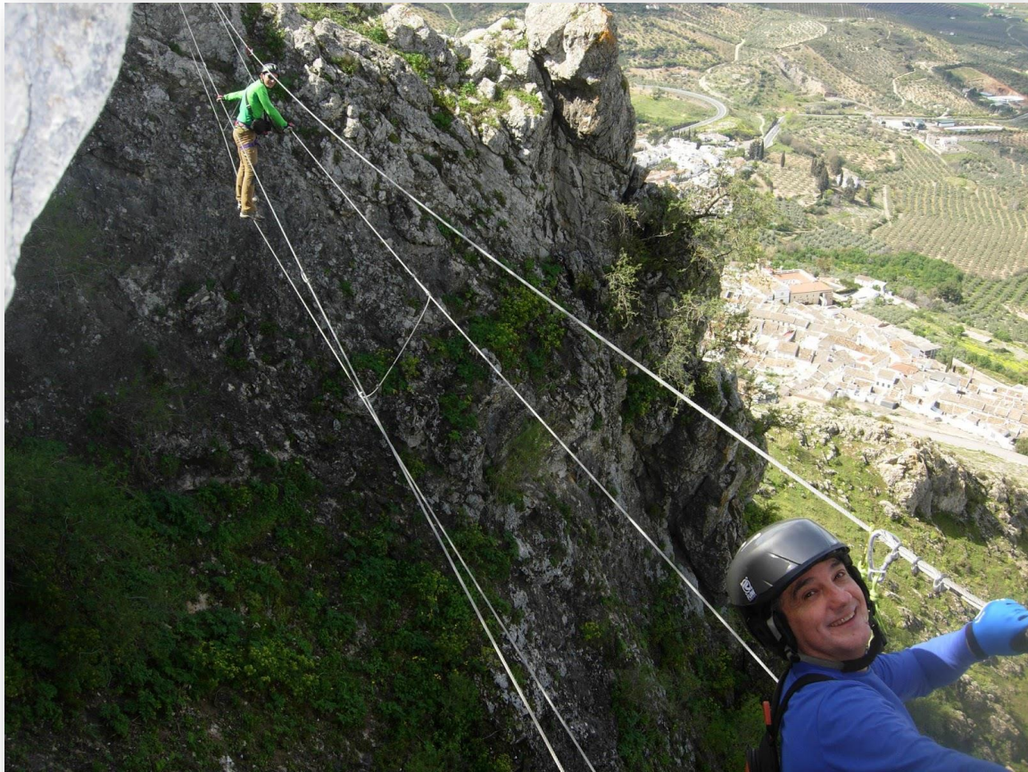
Imagen: Antonio Bueno

Una auténtica experiencia inolvidable y para todos los públicos en el Parque Natural sierras de Cazorla, Segura y las Villas.